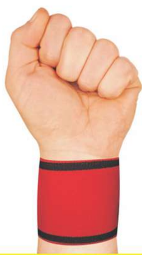
Munhequeira Elástica Ref.: AC440