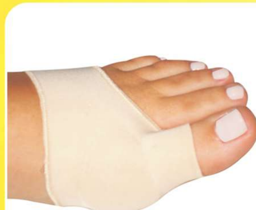
Protetor Para Joanete Siligel Podology