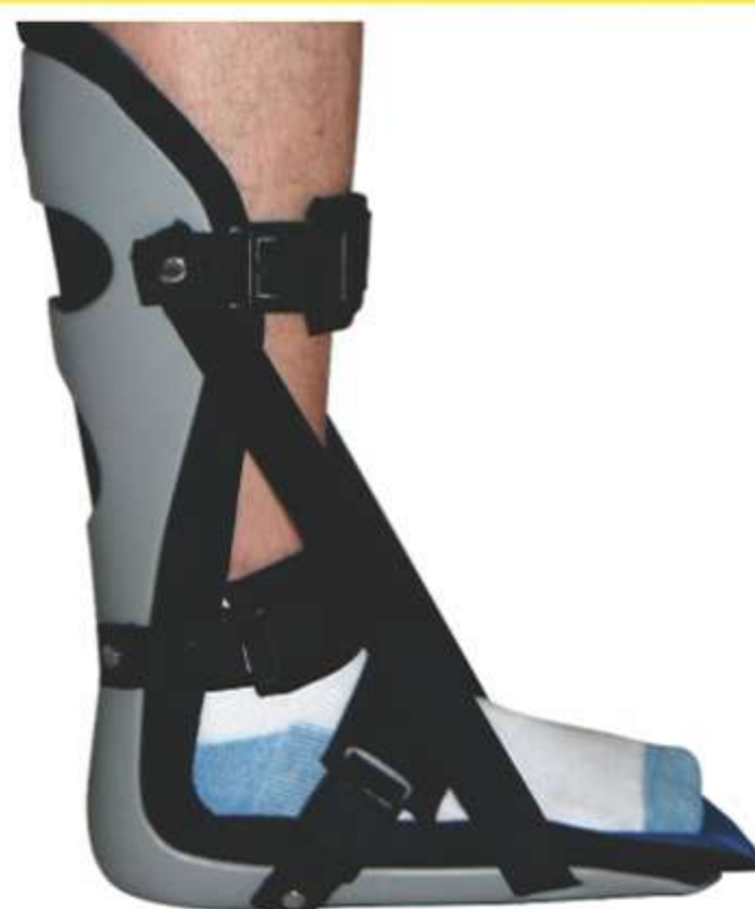
Bota Night Splint para Fascite Plantar Ref.: AC110