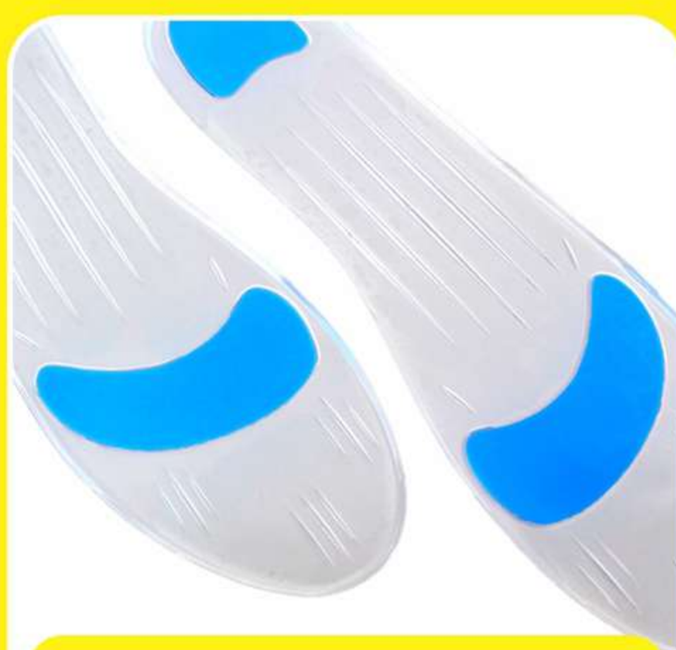
Palmilha Sob Gel