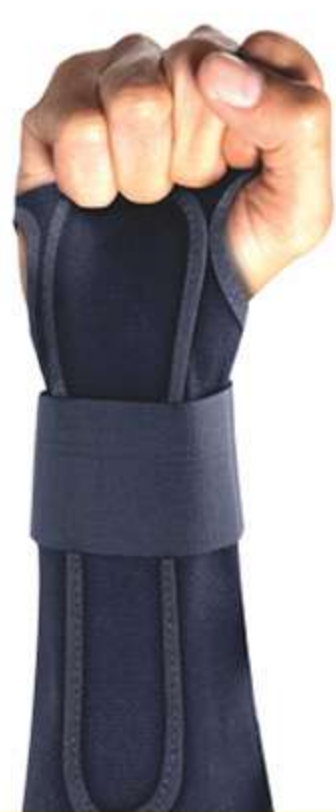
Tala Longa para Punho Bilateral Ref.: AC455