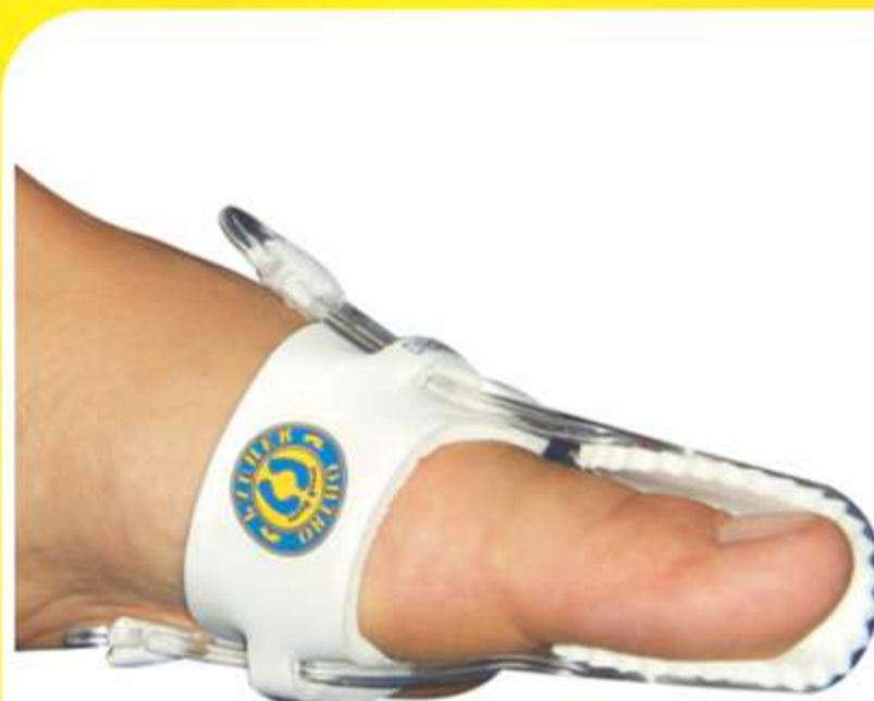
Corretivo para Joanete Hallux Valgus Noturno