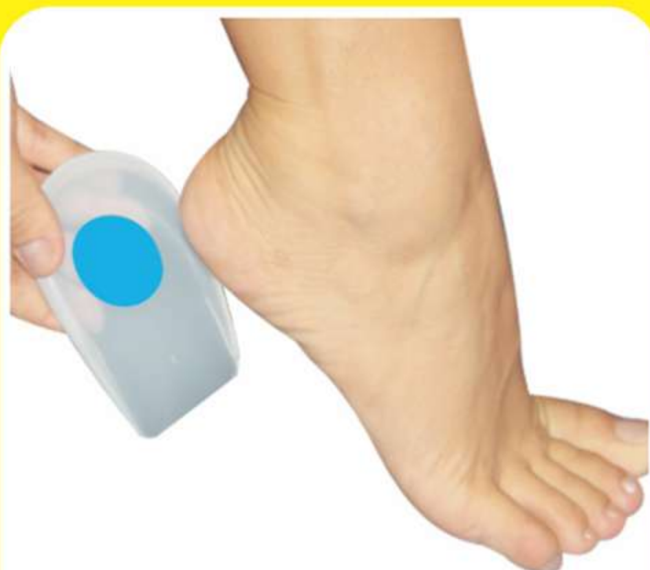
Calcanheira Siligel com Ponto Azul