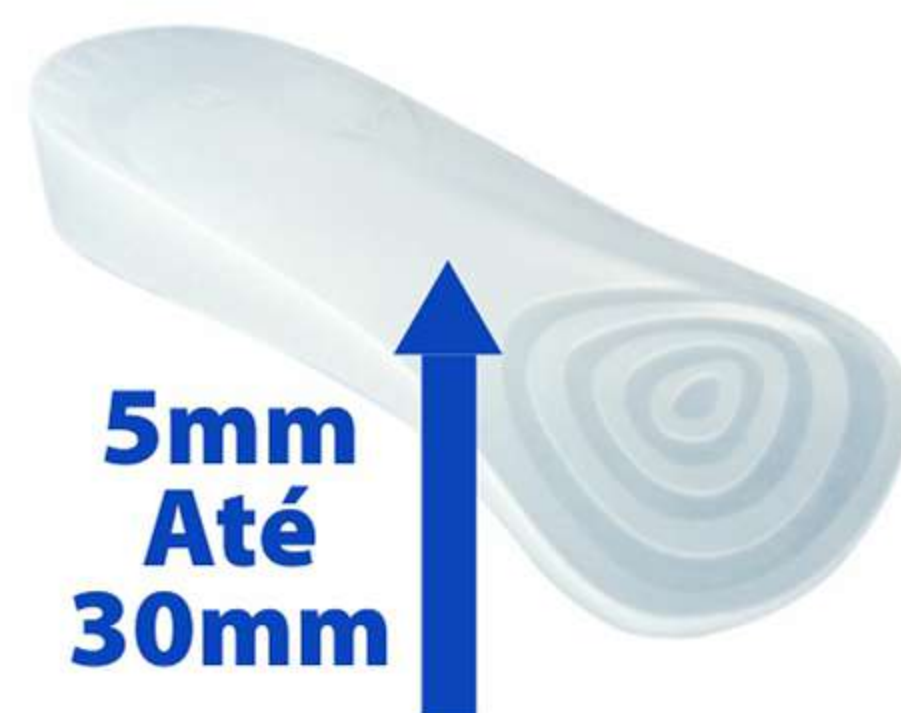
Palmilha 3/4 para Compensação Siligel