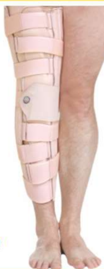
Imobilizador de Joelho Fixo Ref.: AC313