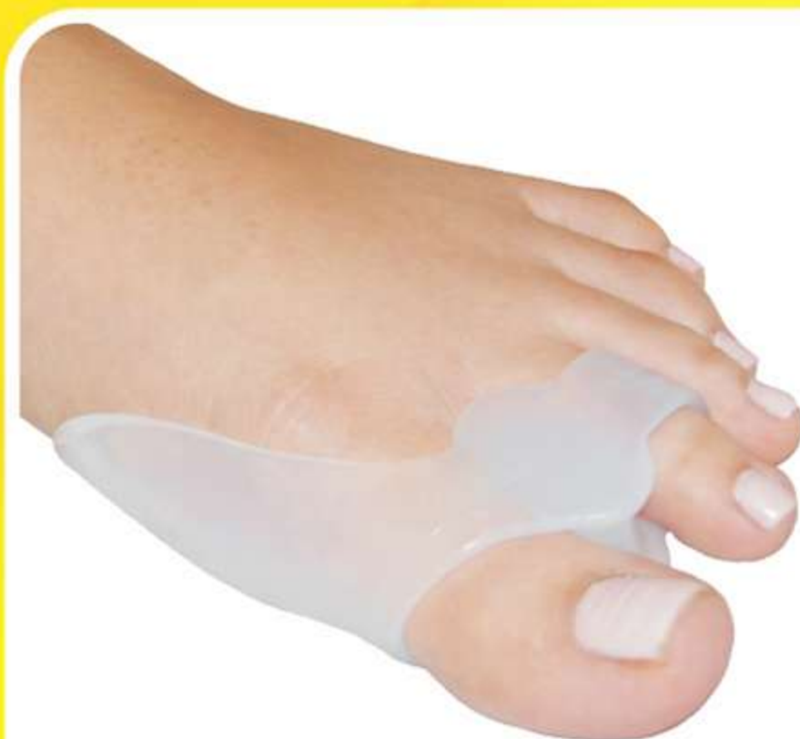
Corretivo Siligel 3 em 1 Ultra