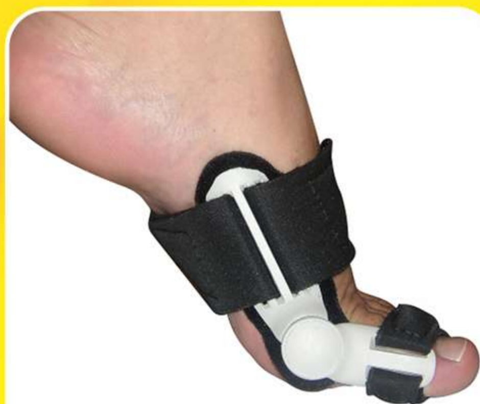
Corretivo para Joanete Hallux Dynamic