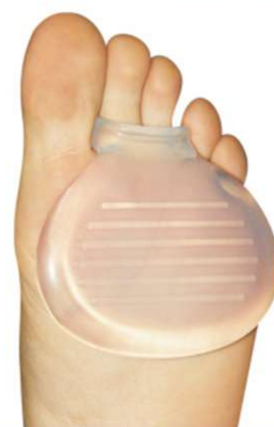
Almofada Plantar com Anel dois Dedos