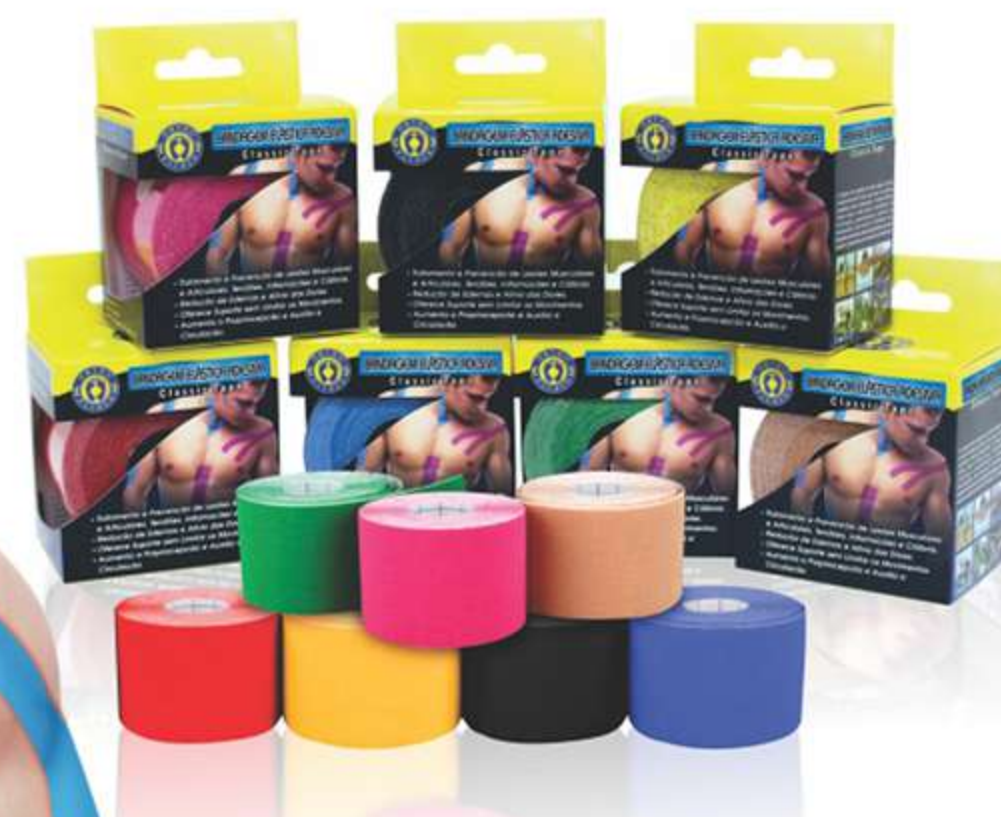
Bandagem Elástica Adesiva Ortopédica Ref.: KP101