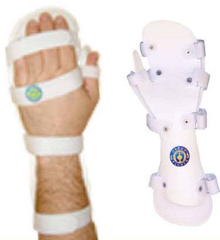
Tala de PVC para Punho Mãos e Dedos Ref.: AC639