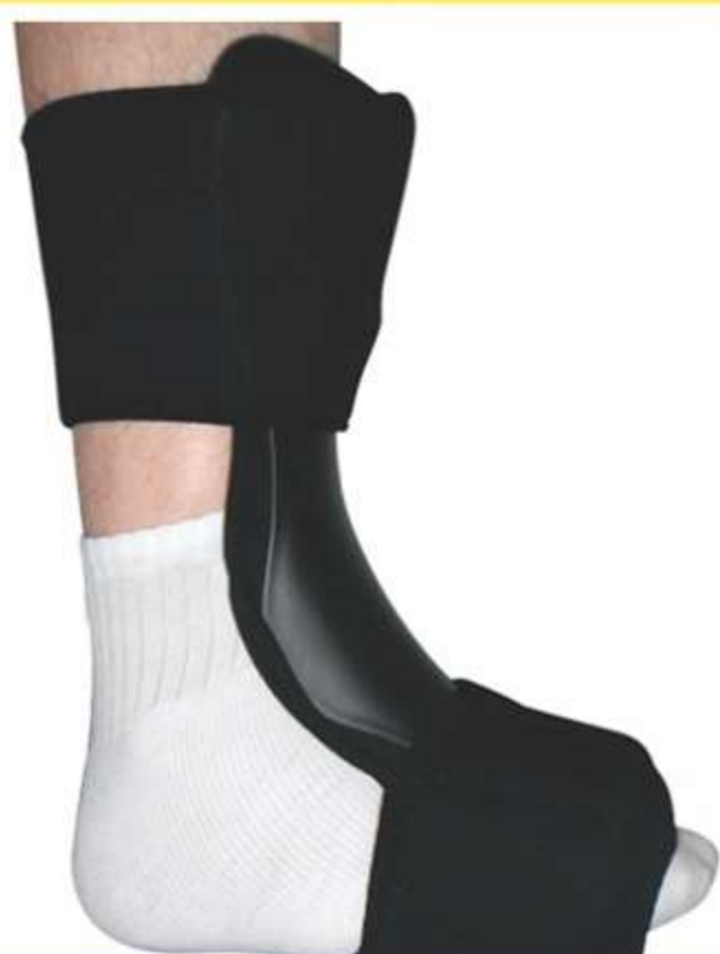
Órtese Noturna para Fascite Plantar Ref.: AC108