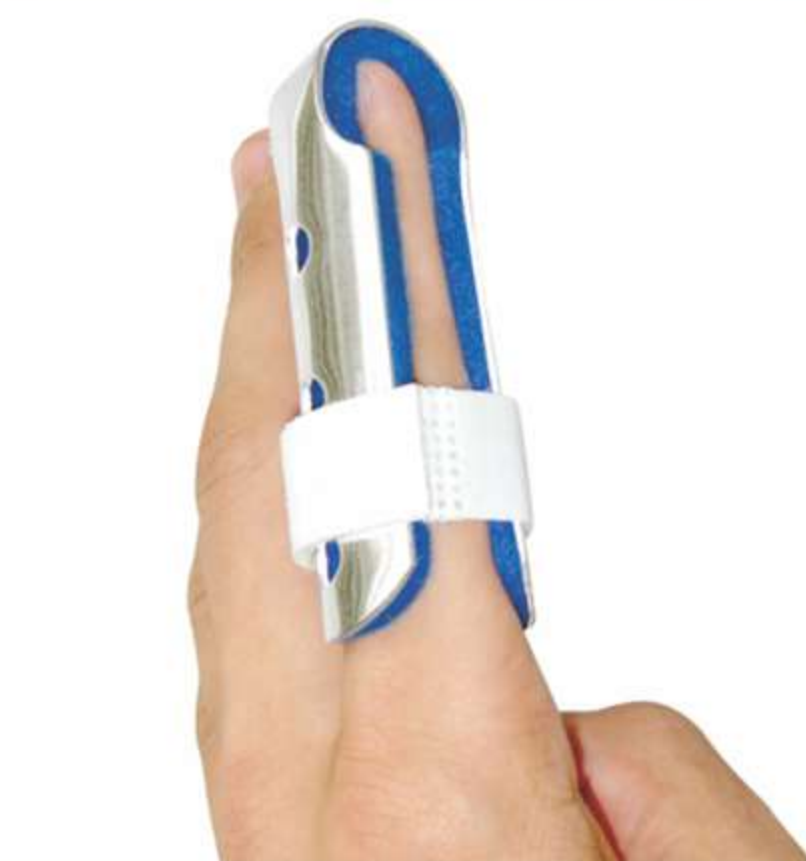
Splint Para Dedo Ref.: AC444/AC446