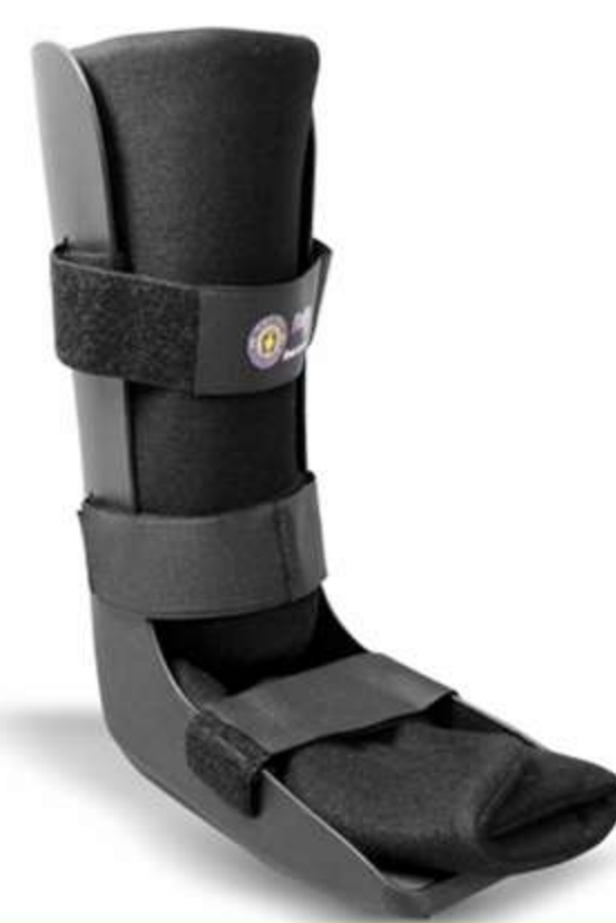
Bota Imobilizadora Longa Ref.: AC208