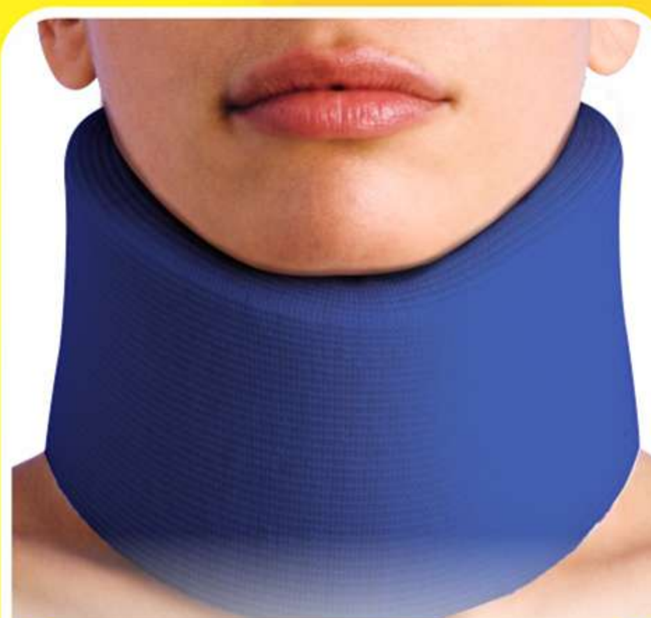
Colar Cervical com Espuma Ref.: AC502