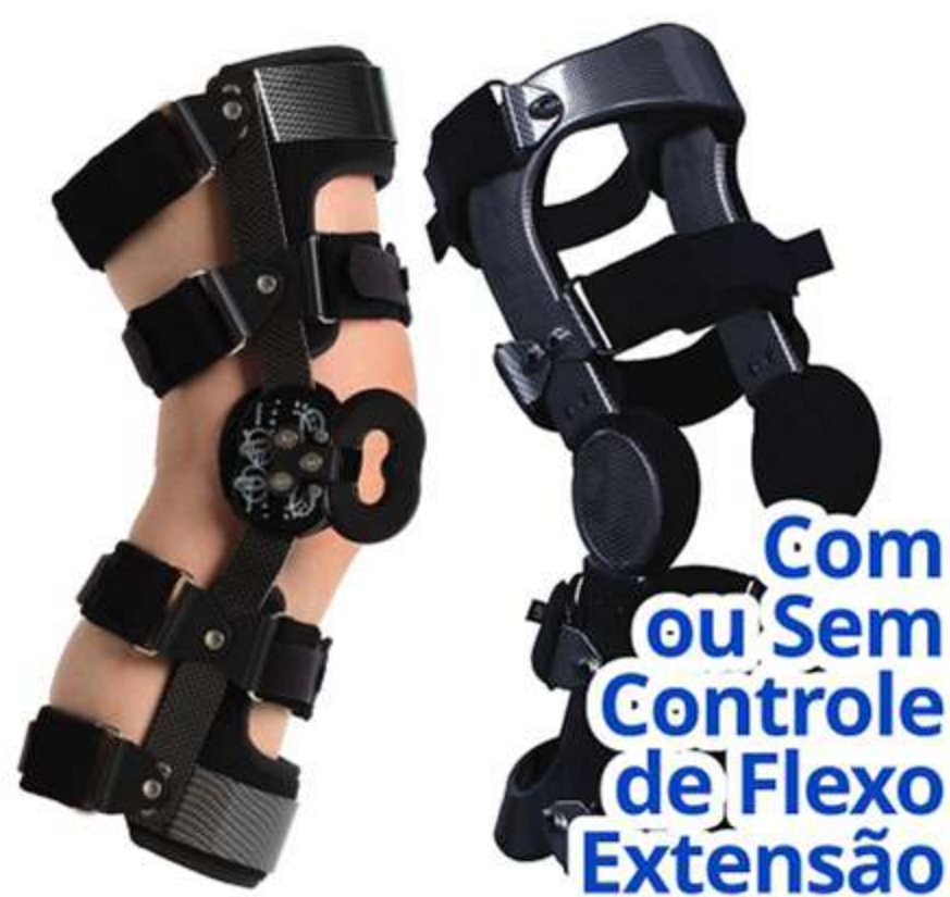
Joelheira Brace com Dois Velcros Ref.: AC305/AC308