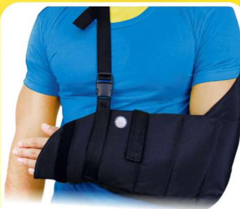
Tipóia Velpeau Luxo Ref.: AC420