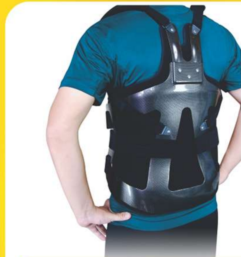
Colete Dorso Lombar Brace Pauher Ref.: AC600