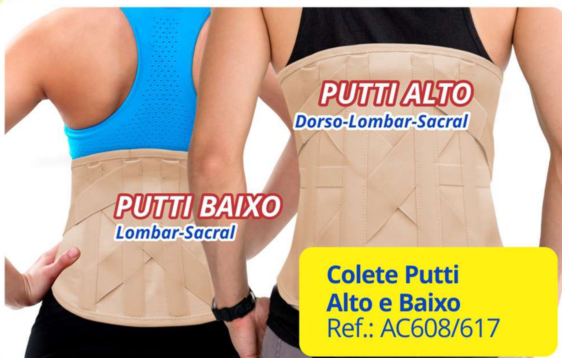
Colete Putti Alto e Baixo Ref.: AC608/617