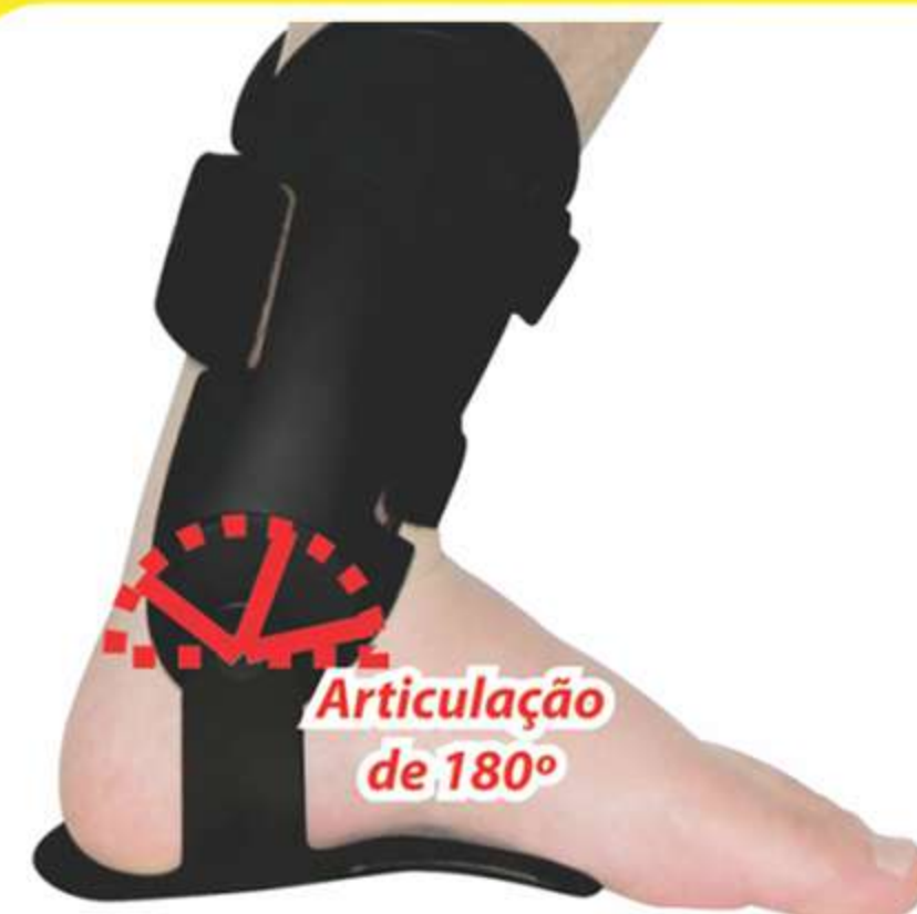
Tornozeleira Articulada Ref.: AC112