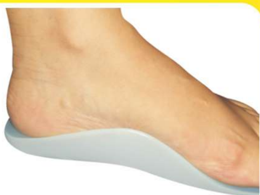
Palmilha Siligel c/ Arco Terapêutico Adulto