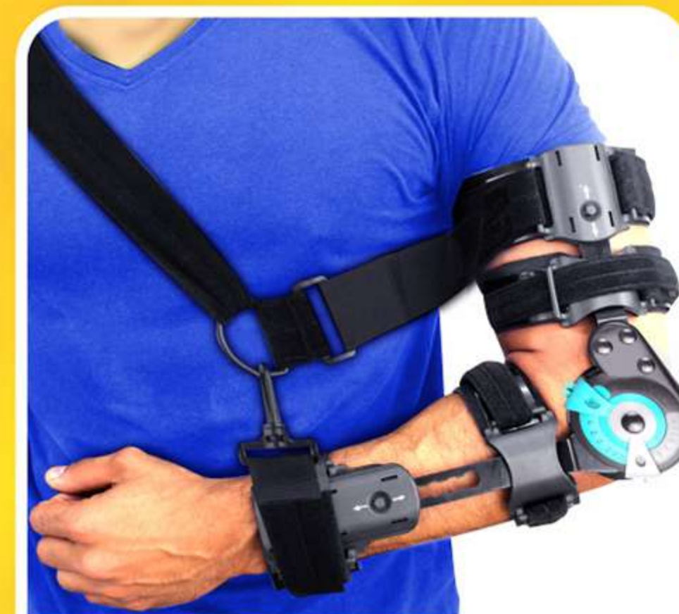
Imobilizador Brace Axilo Articulado Ref.: AC426