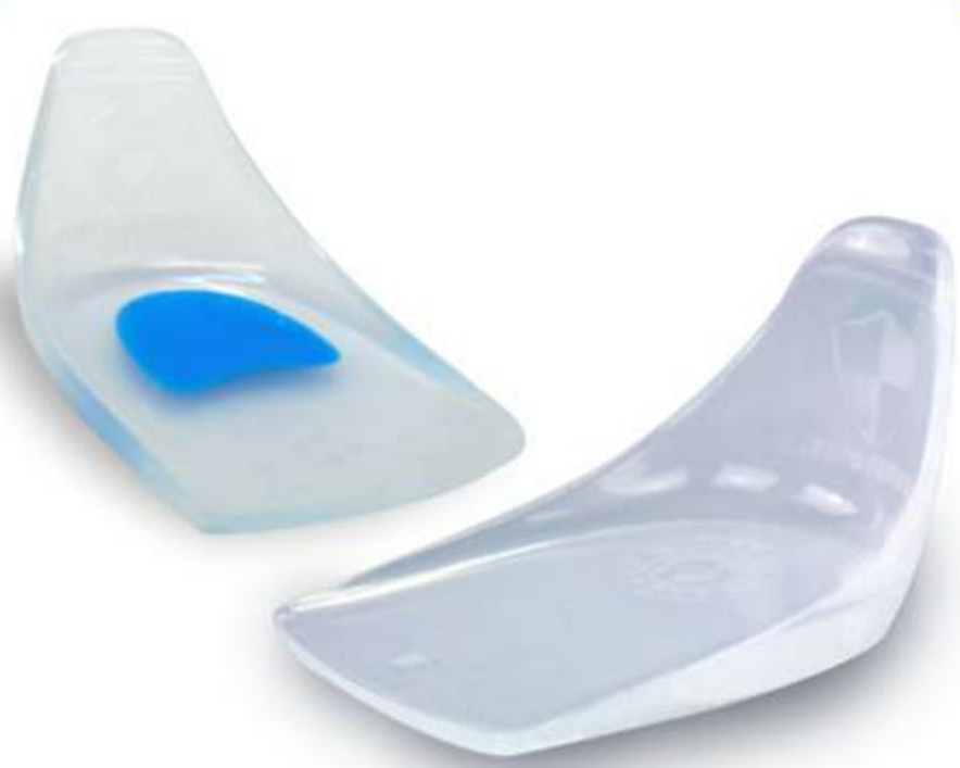
Calcanheira Vertical Siligel Tendon Protect Ref.: 2800/2900