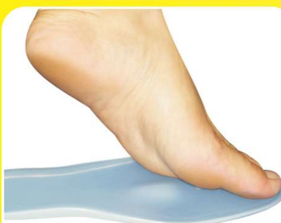
Palmilha Siligel Longa com Arco e Piloto