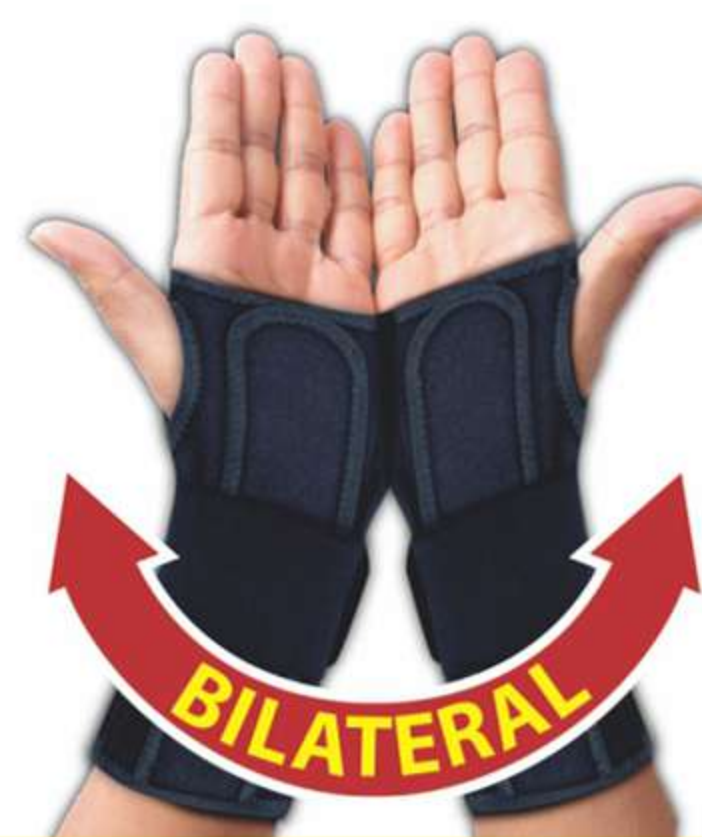
Tala Para Punho Curta Ref.: AC460