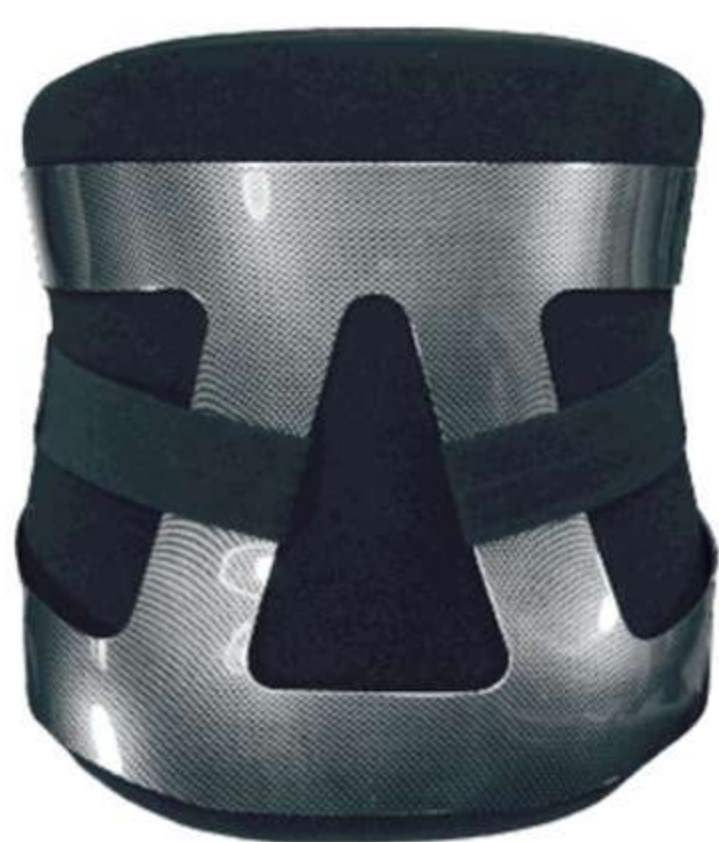
Colete Lombar Brace Pauher Ref.: AC609