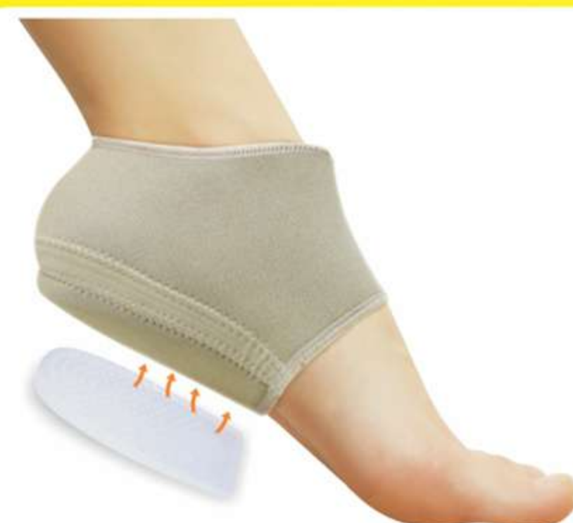
Calcanheira Pauher Support