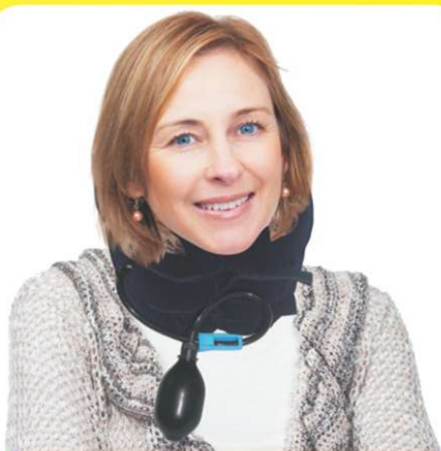
Colar Cervical Pneumático Ref.: AC082