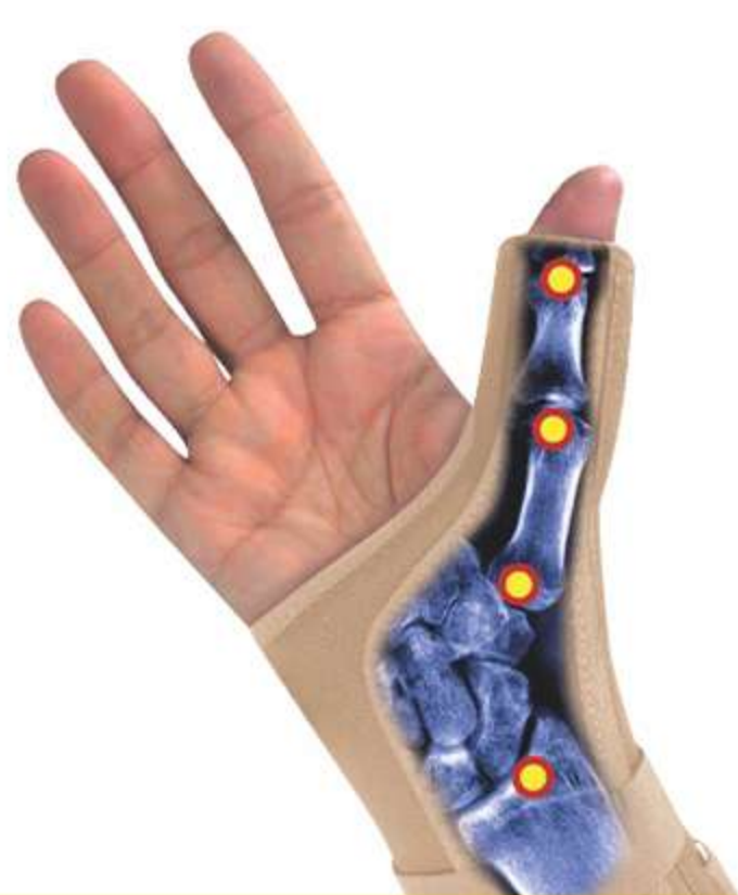
Tala Elástica para Punho e Polegar Ref.: AC456