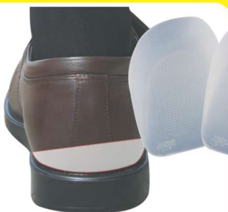
Calcanheira para Desvio de Calcâneo